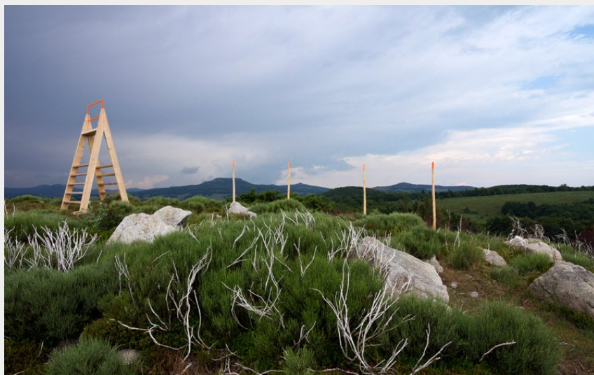
Les Mires du Partage des eaux au Pra Pouzol à Burzet