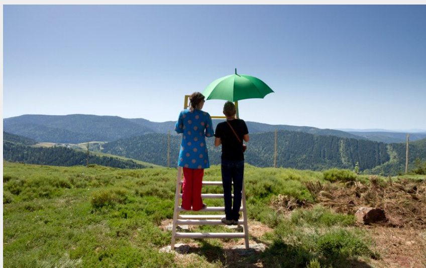
Les Mires du Partage des eaux au Suc de Montat, Saint-Etienne-de-Lugdarès