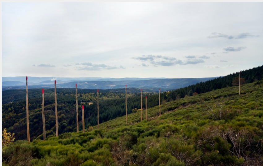
Les Mires du Partage des eaux au Pra Clauzel, SAINT-Laurent-les-Bains