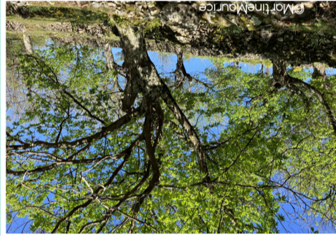
GRANGE SAGNARD, CUPITAT

De belles châtaigneraies en terrasses (ou faisès ) se déploient autour des hameaux de Grange Sagnard ( sanha lieu humide en occitan) et Cuptat. Fruit-roi de ce pays des Hautes-Cévennes ardéchoises, la châtaigne est célébrée chaque automne en Ardèche, lors des Costagnades. À Antraigues, la fête a lieu le dernier week-end d'octobre.